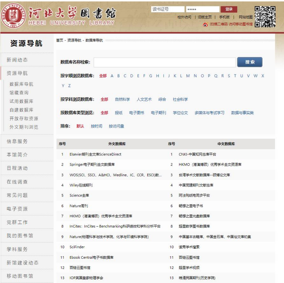
图 3 可供研究生查阅的数据库（部分数据库截图）

各二级学科均有相关图书资料阅览场所。以管理学院资料室为例，目前建设有图书室和期刊室各 1 个，总面积为 560 平米，资料室藏书 2.8 万册，期刊室约有公共管理类期刊 80 种，其中外文 12 种。