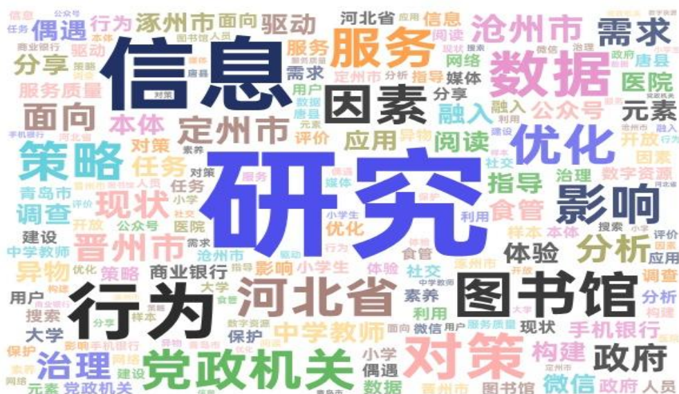
图3 2023 图情专硕毕业论文选题分布图

业在情报收集和情报分析中的技术问题。(4) 阅读推广与用户行为研究主要集中在儿童阅读推广、基于社交平台的阅读推广、网络用户信息行为研究等, 研究结果有助于为各级各类阅读推广和互联网信息服务的改进提供理论指导。